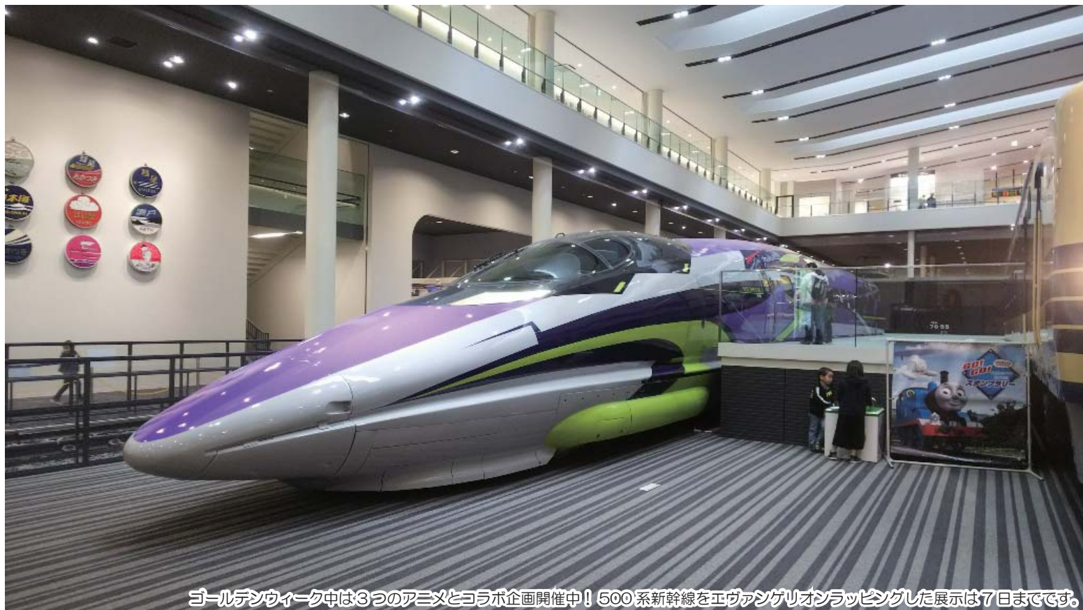
ゴールデンウィーク中は3つのアニメとコラボ企画開催中！500系新幹線をエヴァンゲリオンラッピングした展示は7日までです。