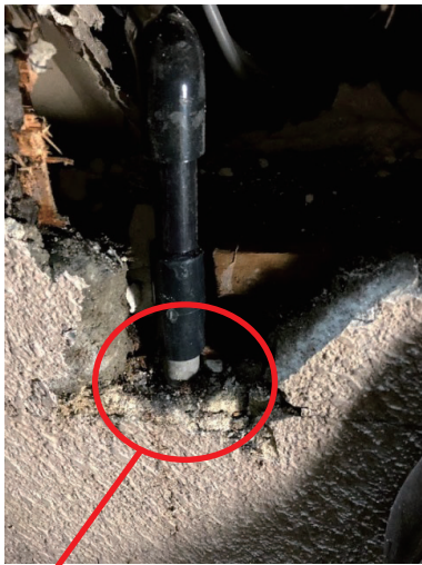
少し見えているグレーの配管がもとの配管

それにしても本当に驚きました。どこか少し他人事として考えていた災害がこんなに身近に、そしてこんなに突然に起こるとは…。日頃の備えがどれだけ大切か改めて考えさせられました。今月号のおかでんしんぶんは地震前に記事を書いていたメンバーがほとんどで、内容が今の時期にそぐわないものもあるかもしれませんが、どうぞご容赦くださいませ。