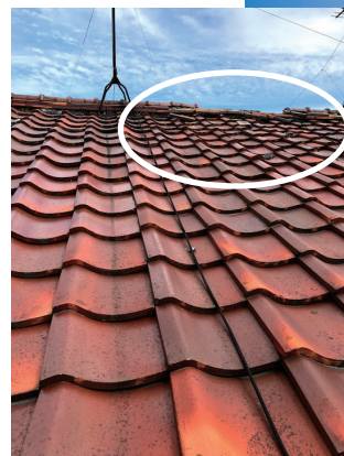
瓦が崩れてしまったおうちもたくさん

は1か所でも漏れていると水道の元栓を止めなければいけません。最優先で水道の改修にまわりました。 翌日はお昼から雨が降るといふことで、屋根が損壊したおうちにブルーシートをかけて回る作業が多かつたです。 実際に屋根にあがって見なければ見えない瓦の破損もたくさんあつたので、おうちの屋根が見えない方は一度点検をおススメします。 今回の地震で壁や屋根の補修をたくさんご依頼いただいております、懸命に対応しておりますが、お待ちいただいている皆様本当にごめんなさい。一日でも早く工事にかかれるようにがんばります！