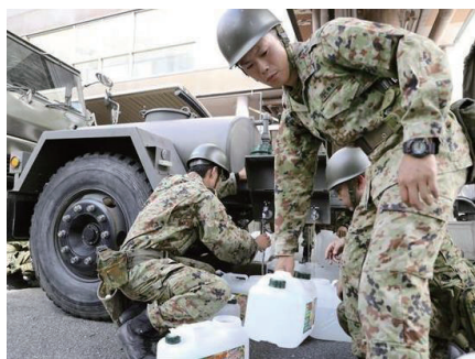
給水作業をする自衛隊員さん

みなさま、先日の地震でお怪我などなかったでしょうか？ 皆さまのご無事を心よりお祈り申し上げます。 我が家でもとても大きな揺れでした。リビングで飼っている金魚の水槽の2つあるうち大きい方が割れてしまい、水槽の棚の下に置いてあった、絵本やCDのケース、おもちゃなどが水浸しになり、敷いていたカーペットもだめになってしまいました。幸い金魚の水槽の小さいほうは無事でしたので、玄関近くの低い位置に金魚の水槽を移し、余震にそなえました。 水がなければ困るのは金魚だけではありません。私たちも